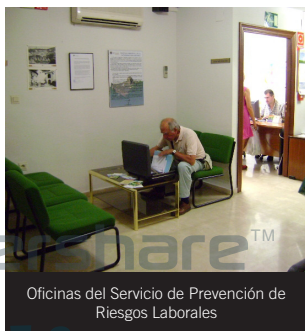
Oficinas del Servicio de Prevención de Riesgos Laborales