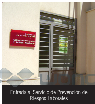
Entrada al Servicio de Prevención de Riesgos Laborales